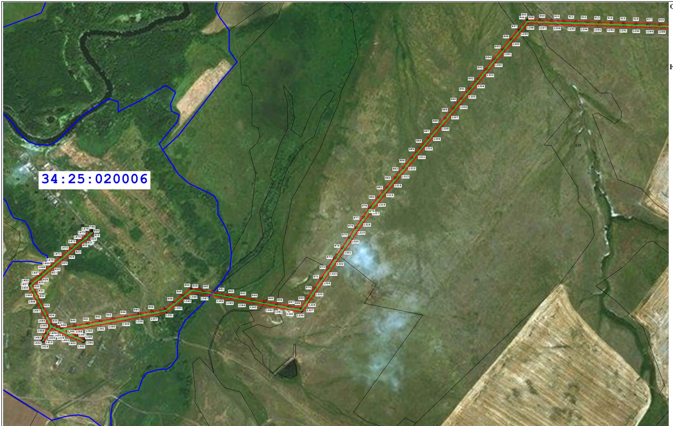
Схема расположения границ публичного сервитута для размещения объекта: ВЛ-8-10 кВ ПС Рудня (наименование)