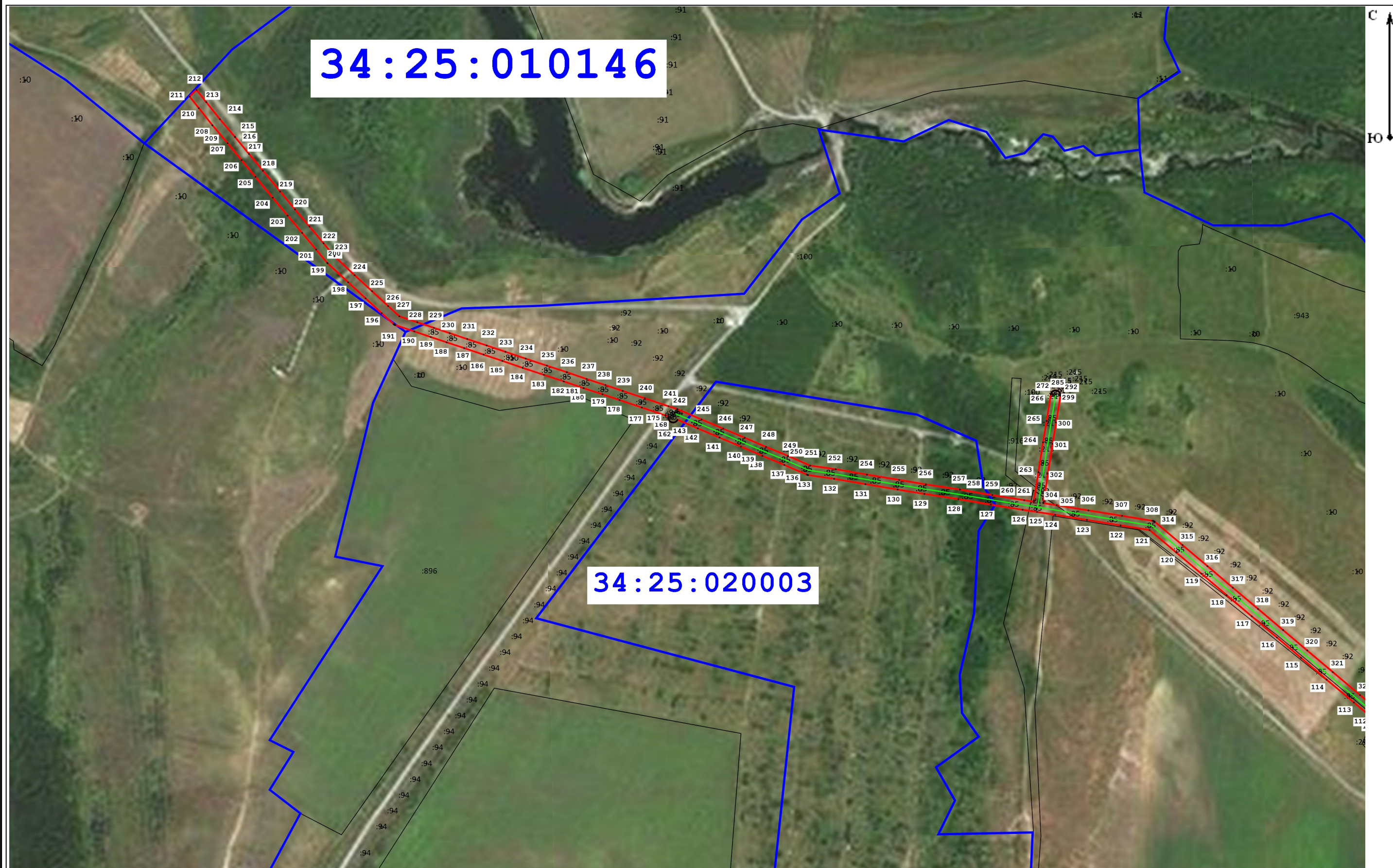
Схема расположения границ публичного сервитута для размещения объекта: ВЛ-8-10 кВ ПС Рудня (наименование)