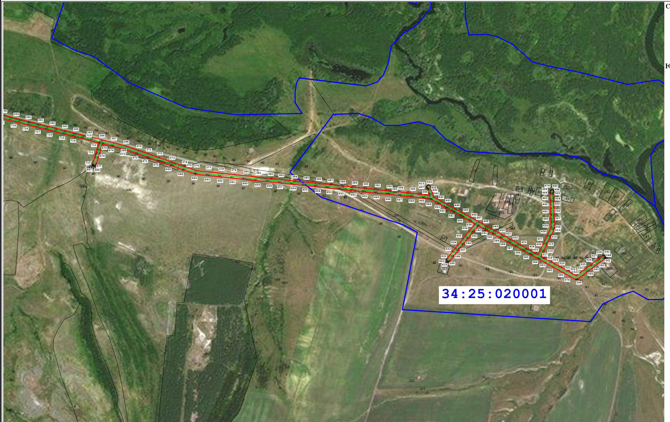
Схема расположения границ публичного сервитута для размещения объекта: ВЛ-8-10 кВ ПС Рудня (наименование)