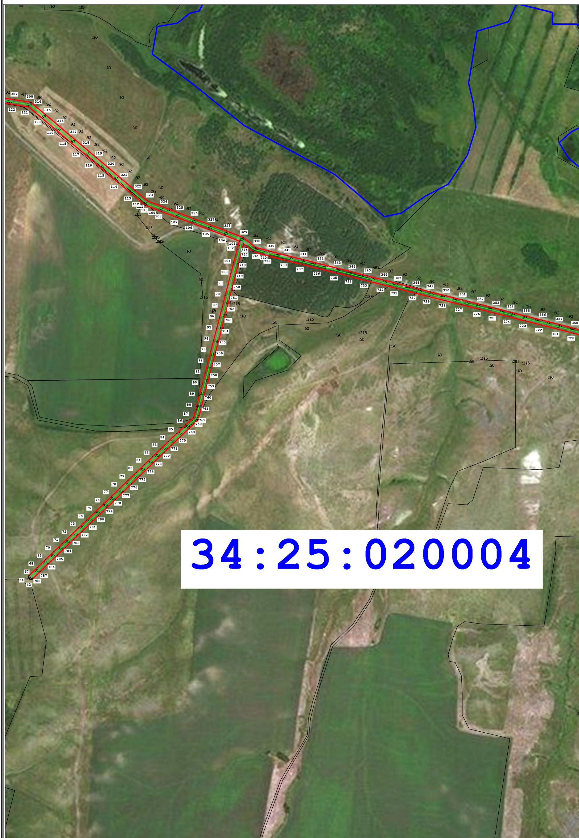
Схема расположения границ публичного сервитута для размещения объекта: ВЛ-8-10 кВ ПС Рудня (наименование)